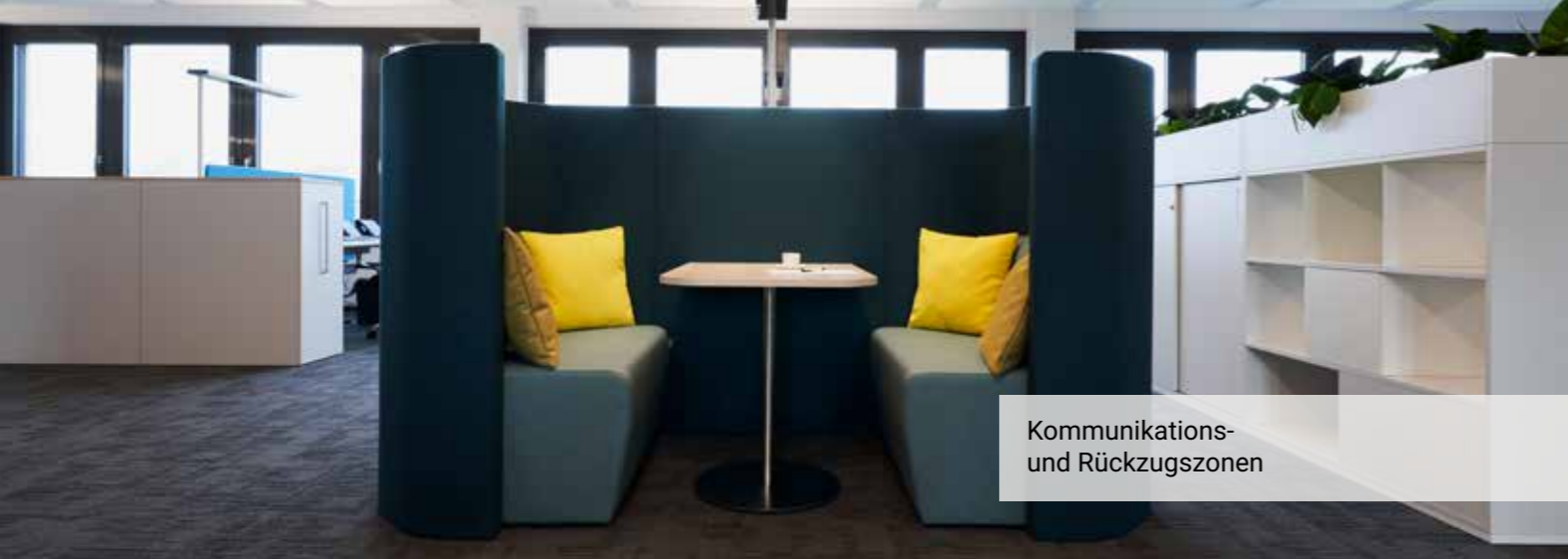
Kommunikations- und Rückzugszonen