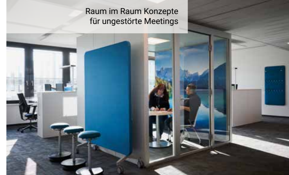
Raum im Raum Konzepte für ungestörte Meetings