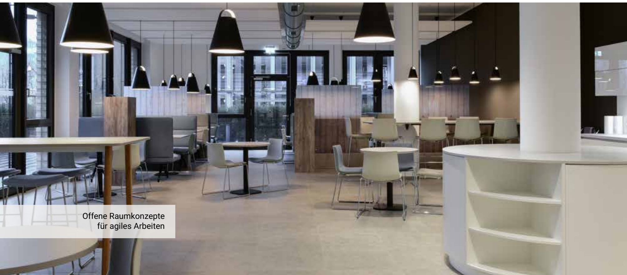
Offene Raumkonzepte für agiles Arbeiten